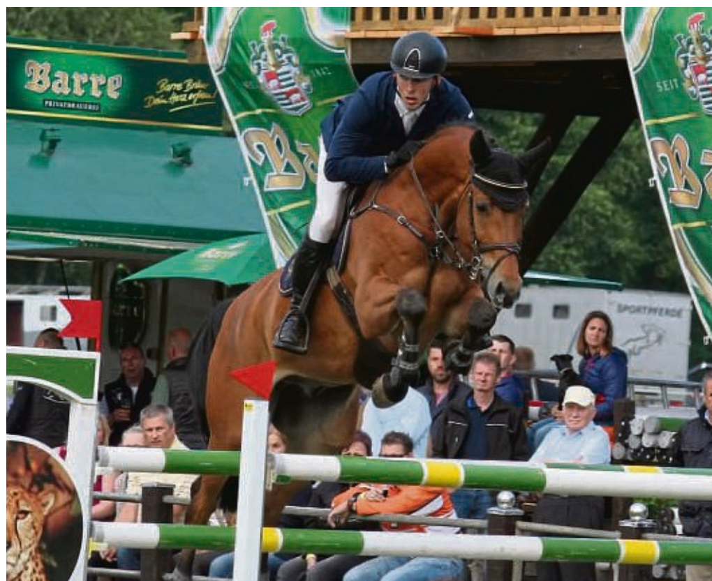
Das Pfingstreitturnier in Ströhen ist immer auch Schaufenster für talentierte Nachwuchspferde. In diesem Jahr werden dort aber keine der begehrten Tickets für das Bundeschampionat gelöst. Das Turnier am Tierparkgelände ist abgesagt.

Ausgeschrieben waren 33 Prüfungen – darunter drei Springen der schweren Klasse. Erhalten hatte der RFV Ströhen erneut Qualifikationsprüfungen zum Bundeschampionat für fünf- und sechsjährige Springpferde. Zu rechnen war mit etwa 1500 Nennungen und rund 800 Pferden. Auch das von vielen Züchtern und Pferdefreunden geschätzte Fohlenchampionat im Rahmen des